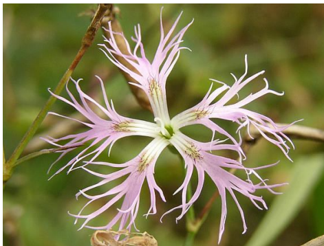
Hvzodík pyšný Latinsky: dianthus superbus L.